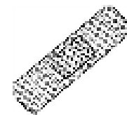
un sparadrap un pansement